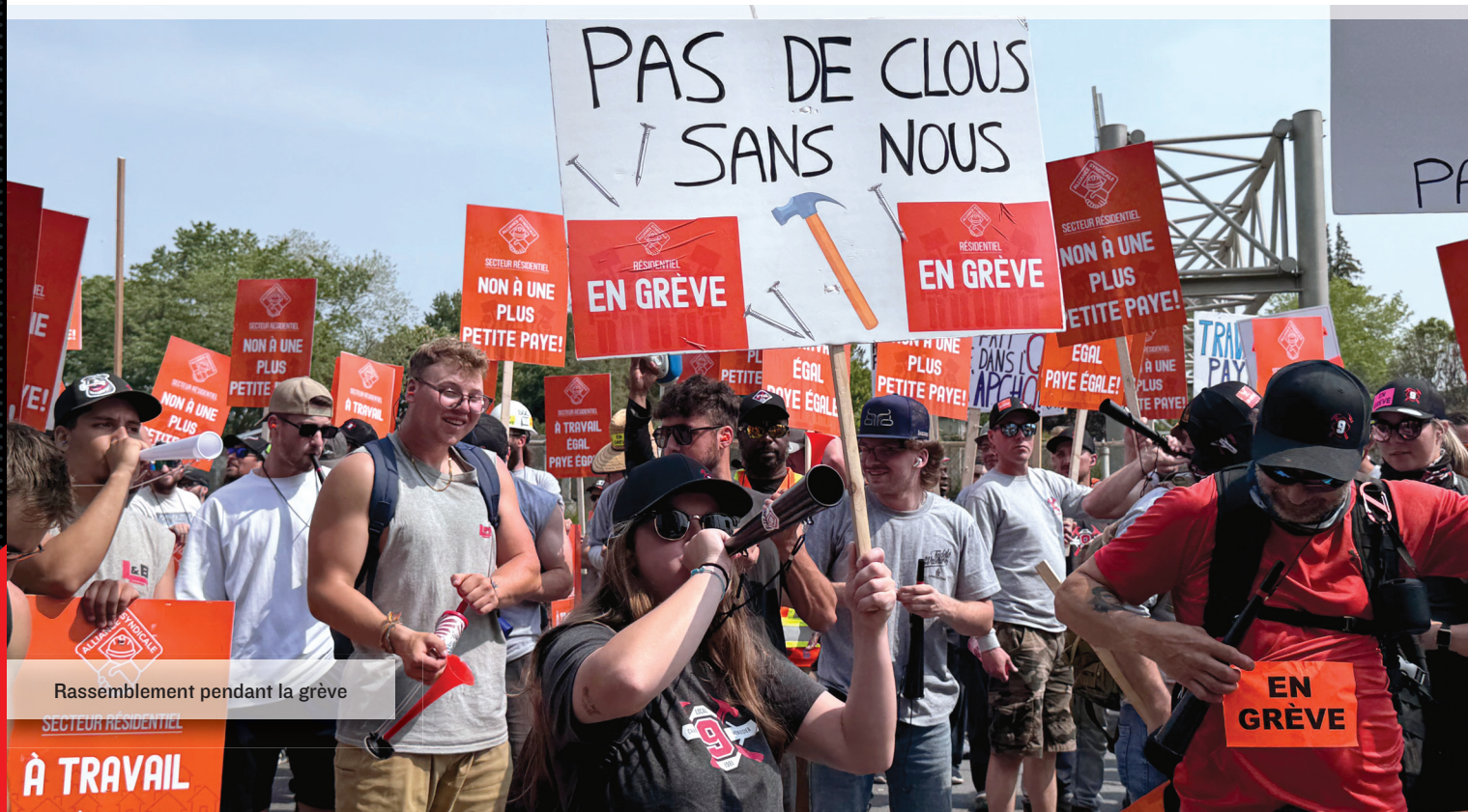
Rassemblement pendant la grève