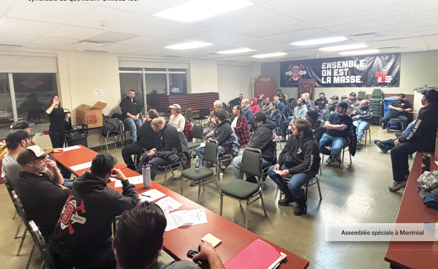
Assemblée spéciale à Montréal