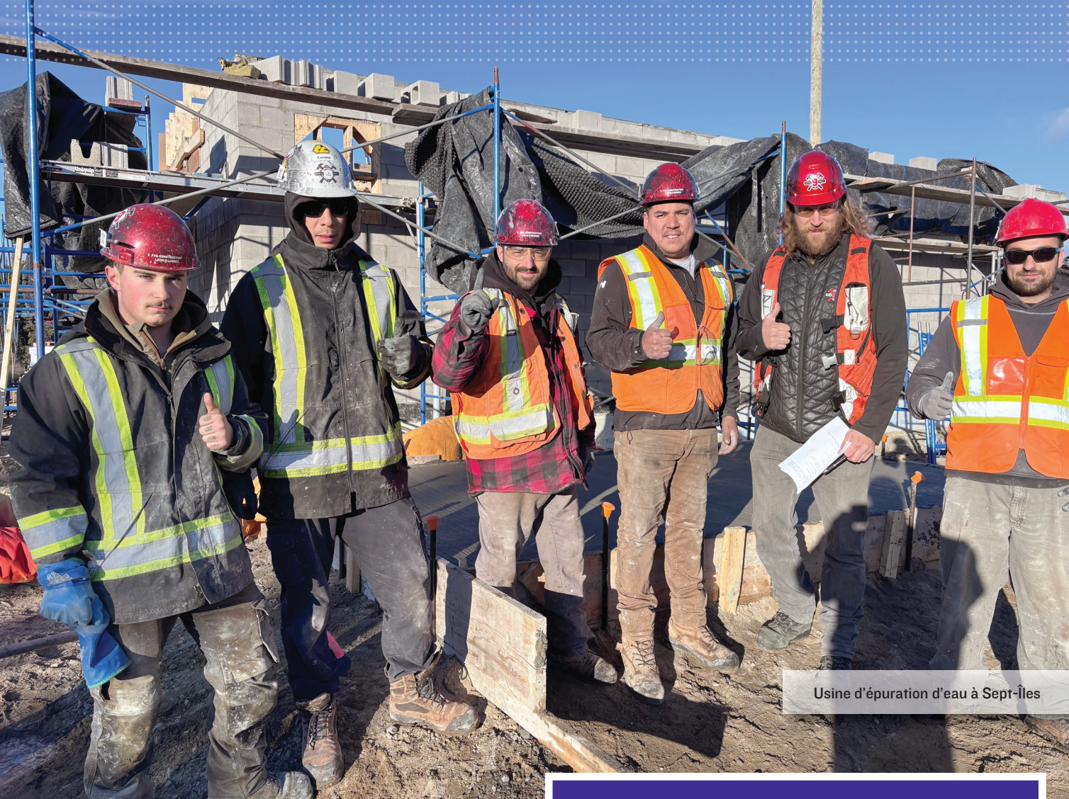
Usine d'épuration d'eau à Sept-Îles