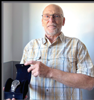
Denis Dubé Centre du Québec